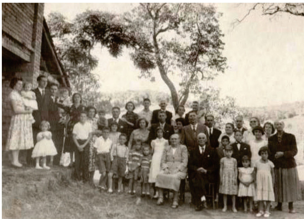
Familia Roman, em 1958